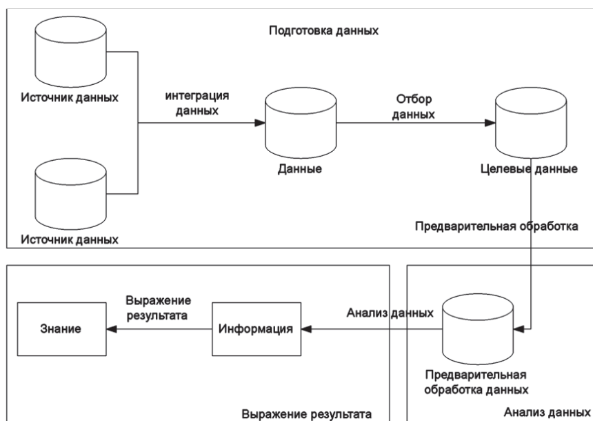
Рис. 2. Общий процесс анализа данных

Процесс подготовки данных должен определить и обработать добываемые данные, чтобы сделать их пригодными для конкретных методов интеллектуального анализа. Подготовка данных является первым важным шагом на пути интеллектуального анализа (datamining) и играет в нем решающую роль рис. 2.